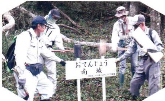
○訪れた人の目に留まるよう…