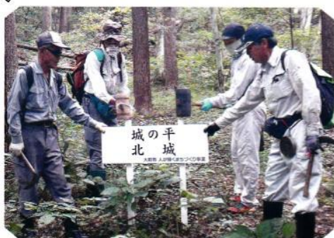
○計画最後の看板の設置…

○都合3日をかけて、訪れる人を迎える準備を整え、一つのモデルコースが出来、“まちづくり”の第一歩を踏み出したものと思います。