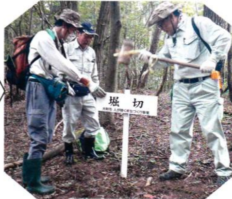
○要領が分かって来て、第一回よりも順調に…