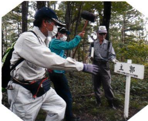
○主郭看板からスタート…

3 ～9/12・第2回作業日～ … 残りの「主郭」「おてんじょう」「城の平」などの看板を設置し、計画した箇所に設置を完了しました。(1箇所は未設置⇒下※)